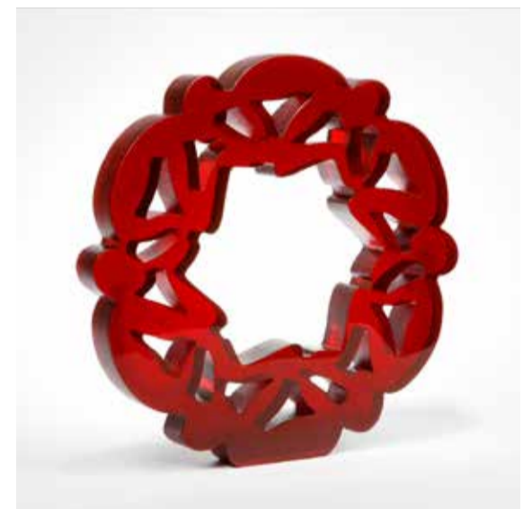
Willem van Oijen, Interconnecting .

bliek in het beeld Trinity - a new religion , drie figuren in wit glas op kathodestraalbuizen. Het meer figuratieve ontwerp spreekt Daeng Ngalle steeds meer aan. Hiermee kan zij meer zeggingskracht meegeven aan haar objecten, bijvoorbeeld in de houding en in de expressie.