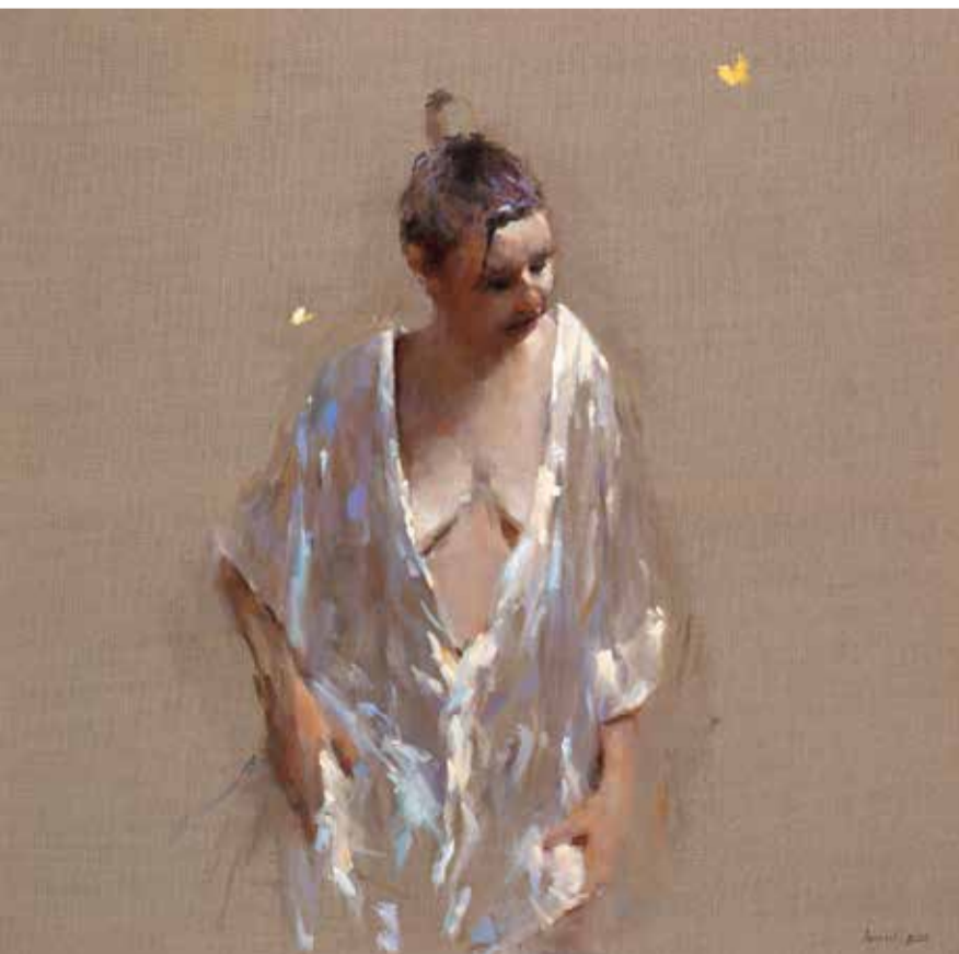
Dinie Boogaart, Witte kimono , 100 x 110 cm.

Uit haar rijke oeuvre zijn in deze expositie haar landschappen, strandtaferelen en naakten te zien. De composities zijn vaak monumentaal door de concentratie van één enkele figuur die het beeldvlak vult. Zij kiest voor grote kleurvlakken in sterke licht-donker tegenstellingen in een samenspel of ook wel een botsing van intense kleuren.