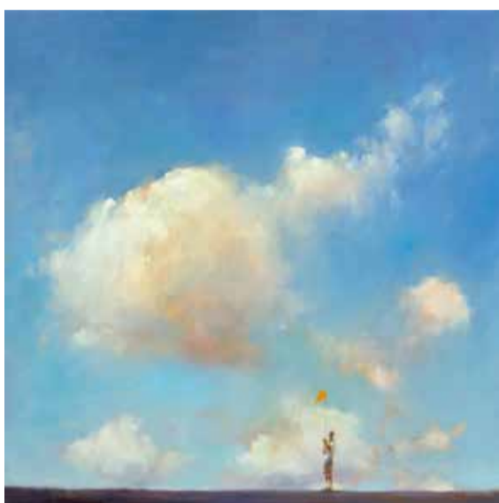
Dinie Boogaart, Dreamer 70 x 70 cm.

Al bij de opening op 1 mei komt de zomer je in de galerie tegemoet. Schilderijen en glazen objecten waar de bezoeker gefascineerd naar kan kijken en misschien zelfs betoverd door kan raken; de kleurrijke composities in het glas en de warme en contrastrijke kleuren in de schilderijen in deze expositie. De fascinatie van Frank van den Ham en Dinie Boogaart heeft ook betrekking op de techniek die zij toepassen, de wijze waarop het glas gevormd wordt of het schilderij ontstaat. Beide kunstenaars hebben zowel nationaal als internationaal hun sporen verdiend.