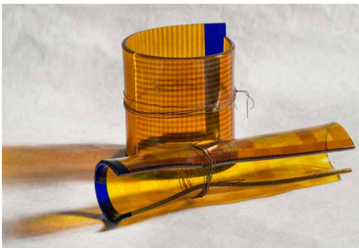
Frank van den Ham, Weerloos , 17 x 35 x 28 cm.

het Museum Vetrario, Murano (Italië), het Kurokabe Museum in Osaka (Japan) en in het Nationaal Glasmuseum in Leerdam.