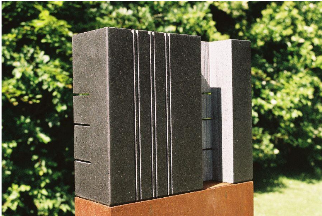
Liesbeth Crooijmans, beeldentuin