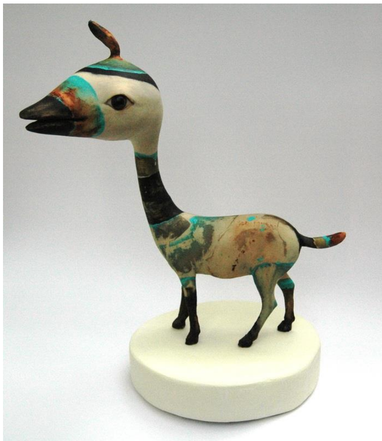
Corjan Nodelijk, 2019 permanente ruimte