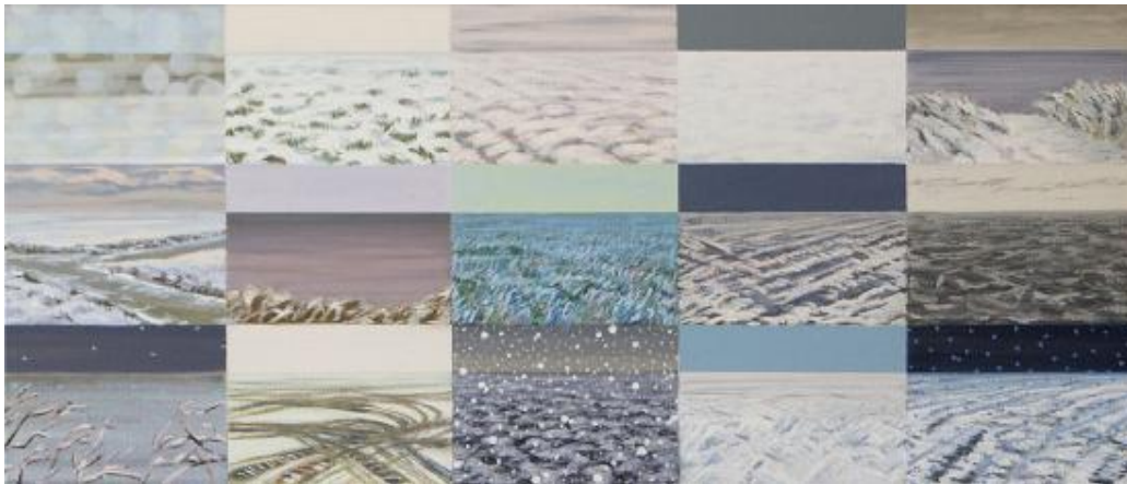
Birgitta ten Berge, 4 e expositie