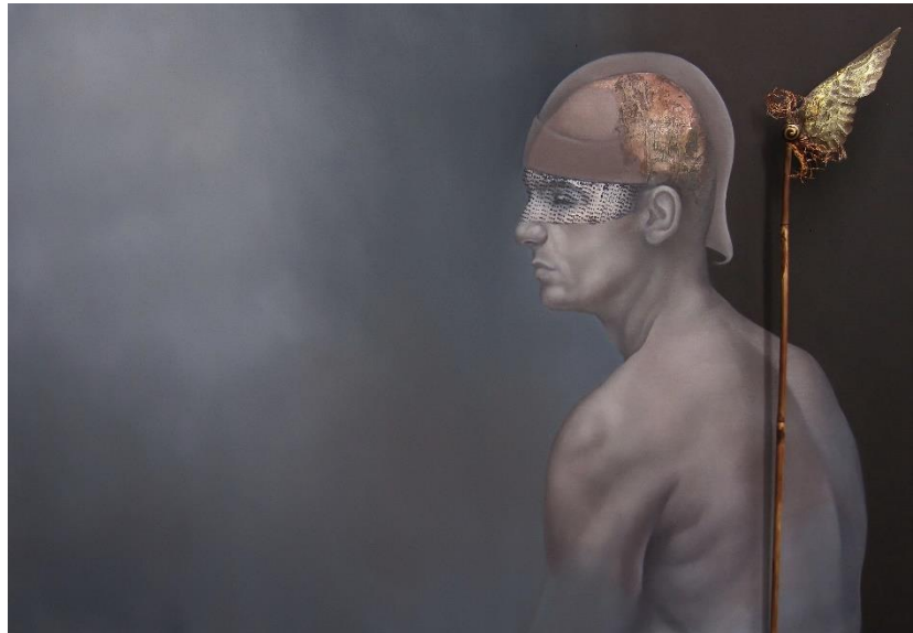
A l'ombre du destin